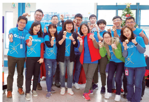
台灣高通公司雪中送炭，幫助居住偏遠地區或需要接送的智能障礙者接送不中斷。

社福團體近年都遭遇募款不易的困難，新竹市天主教仁愛基金會今年也不例外，甚至連交通車經費都出現問題，所幸台灣高通公司雪中送炭，愛心贊助交通服務經費2萬2千元美金，幫助居住偏遠地區或需要接送的86位智能障礙者接送不中斷，並捐贈二手筆記型電腦49台，幫助智能障礙者獲得更多學習與成長機會。