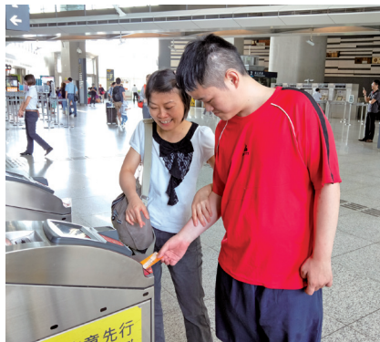
參與社區活動是人際互動與融入社區生活重要的一環，為了讓活動順利進行，教保員需事先再三沙盤推演，達到學習目標。

引起的困難，為了克服這些困難，一次又一次的嘗試，這個方法不行，得另外想辦法，一直到克服困難為止。