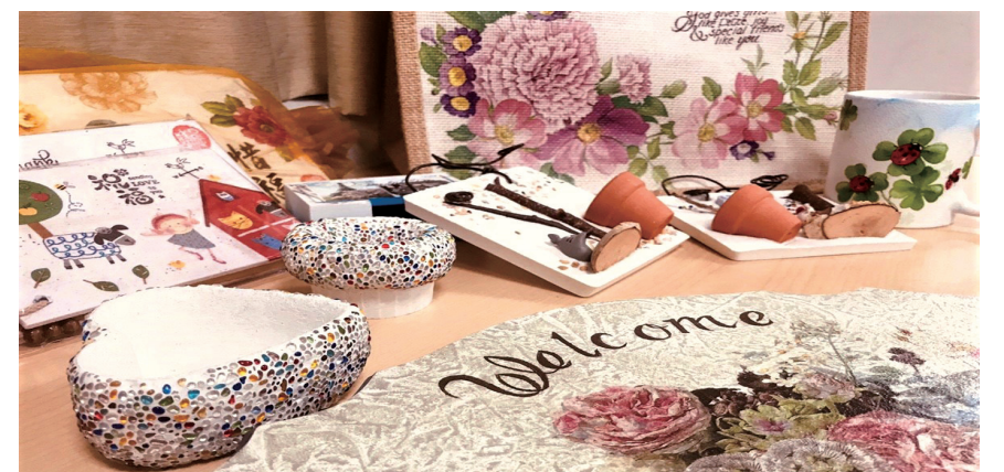
仁愛學員做出美麗的蝶古巴特，祝大家有美好的一年。

因此，仁愛基金會將繼續秉持著「天主是愛，那存留在愛內的，就存留在天主內，天主也存留在他內」（若一 4：16）及「應當歡樂，不斷祈禱，事事感謝」（得前 5:16-18），來從事身心障礙者的社會服務工作；以尊重生命、營造愛的團體、實踐愛德、專業培育並深化心靈陶成…等，作為仁愛在服務工作中銘記於心的價值與精神；也殷切期盼在愛與喜樂氛圍中，讓我們一起同道偕行，更在人與人相遇的路上，感受到生命的良善與溫暖。