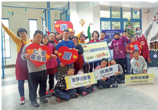
感謝台灣應用材料公司贊助服務學習經費