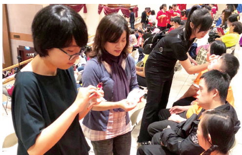
上台前教保員協助化妝，讓每個人帥氣、美麗的上台表演。

今年夏天打擊樂坊的服務對象，一起決定參加「心智障礙者才藝競賽北區初賽」，展開了一場旅程，旅程中有歡笑、辛苦與各種情緒，大家都很努力的參與其中，克服及面對問題，學習及調整自己，一起完成一件很棒的事情，要練習的