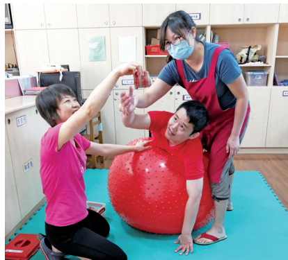
教保員藉由有趣、簡單的伸展操活動，讓服務對象做伸展動作，增進身體健康。

雖然，身心障礙者在旁人眼中可能不完美，但是他們教會我們要珍惜生命，知道生命有無限的發展與可能。