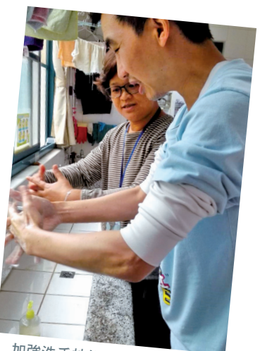
加強洗手技能，減少病毒傳播機會。

面對新型冠狀病毒的威脅，仁愛邀请您一起努力、平安度過這次疫病。相關資訊可至疾管署網站查詢或撥打1922(或0800-001922)洽詢。 網址： https://www.cdc.gov.tw