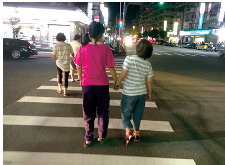
手牽手過馬路，美好的友誼終於開花結果。

美好的友誼終於開花結果，現在，美美與安安面帶笑容主動牽起友誼的手！這是教保員最大的成就。