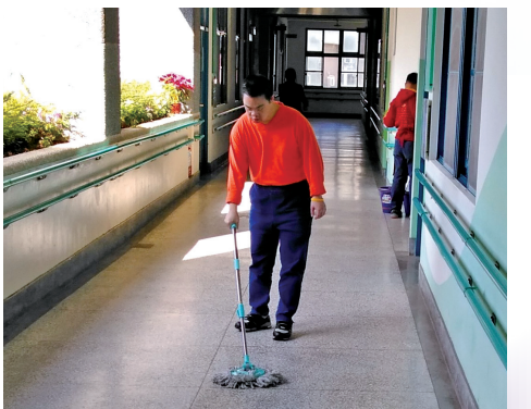
室內與室外的空間不一樣，要有好的空間概念，才能依序打掃。