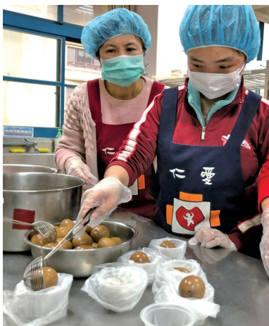
分裝滷蛋準備銷售。