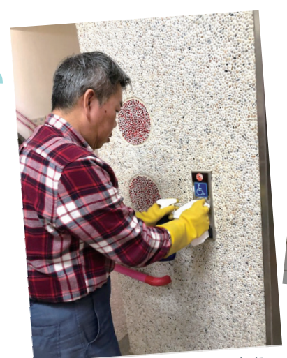
電梯按鍵每日皆有消毒，讓大家安心使用。

仁愛將隨時注意疫情，並將依據政府指示、視需要調整防疫相關措施，請家長（屬）及各界朋友們安心及予以協助，和仁愛一起守護服務對象的健康。雖然目前沒有疫苗或藥物可預防或治療新型冠狀病毒肺炎，但我們可透過感染控制措施，讓病毒遠離我們，包括： 1. 適時配戴醫用口罩：出現呼吸道症狀或是在密閉空間就配戴口罩，保護自己和他人。 2. 以肥皂勤加洗手：使用肥皂確實搓洗乾淨，就能降低病菌傳染的機會。 3. 自主健康管理：隨時留意自己身體狀況，定時測量體溫，如有發燒不適（額溫超過37.5）應盡速就醫。 4. 維持健康體魄：均衡飲食和多運動，以良好的抵抗力對抗病毒。