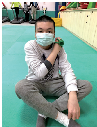
學習手指棒敲槌肩頸處的穴道，舒緩肌肉酸痛。