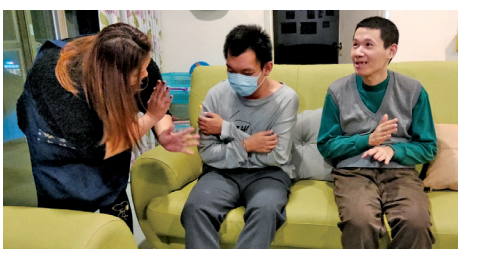
教保員(左)指導服務對象兩性關係的正確觀念。