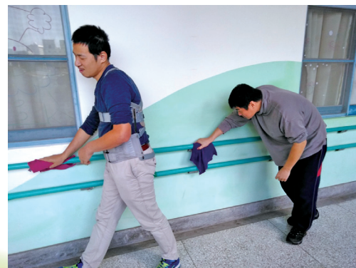
兩人分工，學習擦拭安全扶手。

新的年度來臨，迎接新挑戰，當您在晨曦發展中心的走廊上看到辛勤工作的服務對象，記得要給予加油打氣，「代工坊」Fighting~~~。