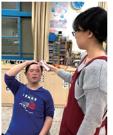
定時量測體溫，落實自主健康管理。

讓我們一同懇切祈禱：慈愛的天父，在此病毒入侵的憂苦中，請保祐我們身心靈平安，增加我們的信德，大家同心協力、團結一致，共度難關，早日恢復平安喜樂的生活。