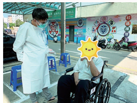
社工（左）陪同需機構安置的服務對象進行 PCR 核酸檢測。