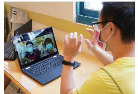
「公益信託葉慈社會福利基金」捐助筆電及無線 AP，提供服務對象視訊教學。