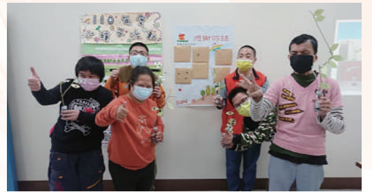
生死教育活動中完成手作心樹,大家開心合影。