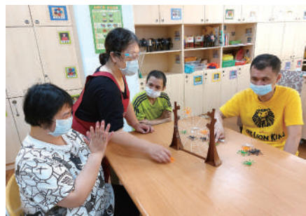
大家一起開心玩桌遊 - 彈跳蜘蛛。

什麼是身心障礙機構最好的服務呢？我們相信只要持續提供對人及環境的用心，就能讓服務對象感受到生活的品質和幸福感，這也是機構為社會所帶來健康、傳愛、樂融合的祝福。