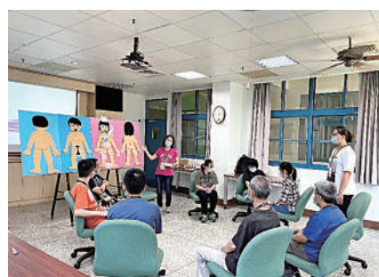
課程中藉由圖卡認識身體的各部位。

第二單元為「自己的身體自己保護」，用淺顯易懂的歌詞編製成口號，讓服務對象在唱跳中，學習與他人之間的正確互動，藉此保護自己。為了讓他們在輕鬆有趣的氣氛中，學習如何保護自己的身體，教保員製作了桌遊卡牌，利用玩桌遊的方式，讓大家除了複習上一個單元，還能學習到這次單元所要學習的內容；當服務對象卡牌抽到影片討論，教保員會即時拿出平板，讓他們觀看影片後回應問題，服務對象答對題目，桌上的星星集點卡越來越多時，