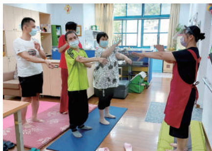
經絡拍打強化免疫力保健康。