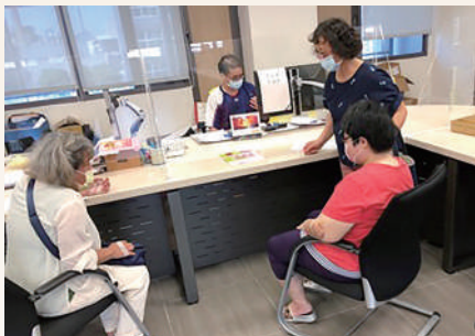
陪同並協助服務對象申請低收入身分。

與仁愛十年的緣分，回溯到民國 95 年找工作時，好友們認為我將家庭照顧得很好，適合服務「人」的工作，也引薦我到仁愛啟智中心應徵教保員。