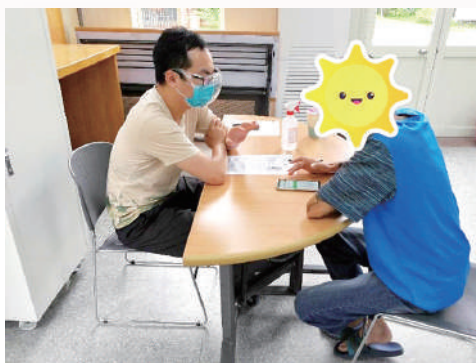
社工（左）向服務對象說明紓困補助。

疫情拉開了人與人的物理距離，科技防疫更加深了身障者參與社區生活的社會距離，懇求天主讓這群為近千個早療及身障家庭奔忙的社工們，能保有平安及堅毅的心，持續實踐身障公約中「Nothing about us without us」（沒有我們的參與不要替我們做決定）的精神，讓服務對象能平安度過疫情、安穩地走向屬於自己的幸福道路。