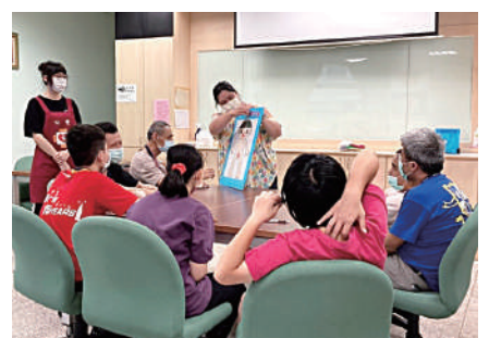
教保員利用巧思製作圖卡進行桌遊活動。