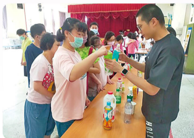
看著一整桌的飲料瓶，服務對象眼睛都亮了。專業資源部精心策劃與辦理健康闖關活動。