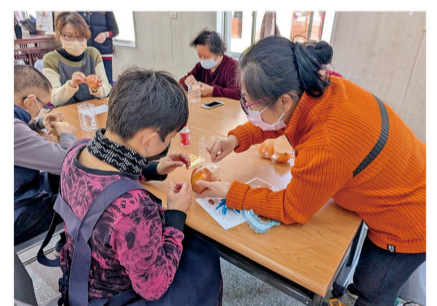
社區民眾(右一)引導服務對象剝除洋蔥外皮。

活動結束後，教保員詢問服務對象參與的感受，大家臉上都洋溢著滿足的笑容，紛紛表示：「下次還要再參加 DIY 活動！」這次的洋蔥娃娃 DIY 不僅讓服務對象體驗了創作的樂趣，也透過與社區民眾的互動，讓彼此的距離更加貼近，為社區共融寫下美好的篇章。