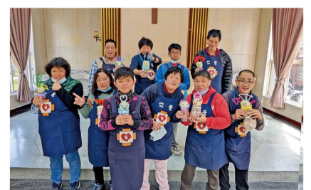
服務對象充滿成就感展示自己的作品開心合照。