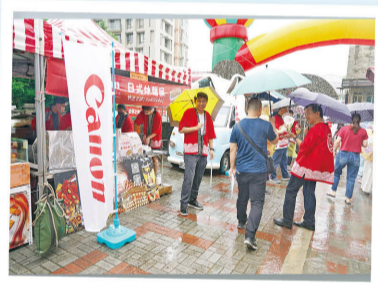
佳能半導體羅時權協理(右二)在雨中義賣日式炒麵及鯛魚燒。