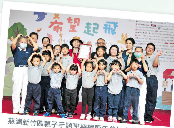
慈濟新竹區親子手語班持續兩年參加公益表演。