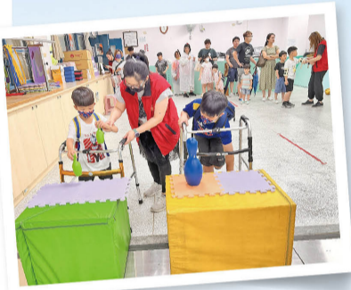
仁愛關關遊戲宣導身心障礙服務，親子踴躍參加。

活動當天，雖然下起大雨，仍澆不熄大家的熱情，衷心感謝所有朋友為公益揮灑汗水，凝聚愛與溫暖，我們相約明年見！