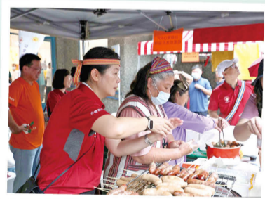
台積電 Q&R 結合原民部落美食設攤義賣，傳遞兩份愛心。