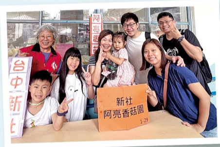
阿亮香菇園親友團將產品銷售一空，捐贈全數所得。