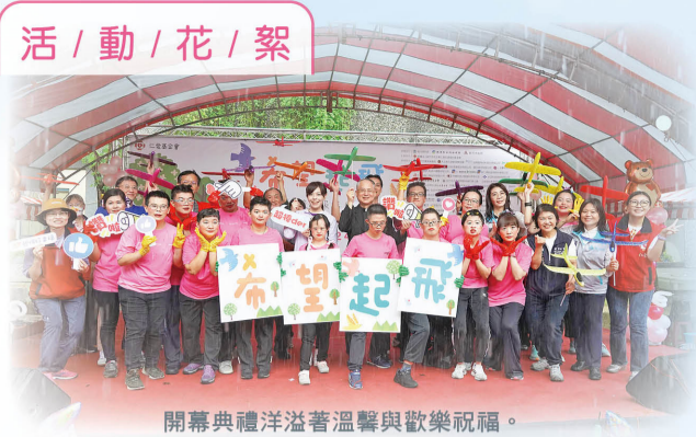
開幕典禮洋溢著溫馨與歡樂祝福。