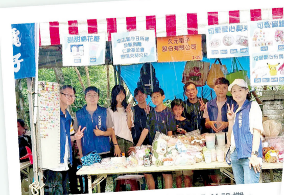
久元電子夥伴們在滂沱大雨中參加公益設攤。