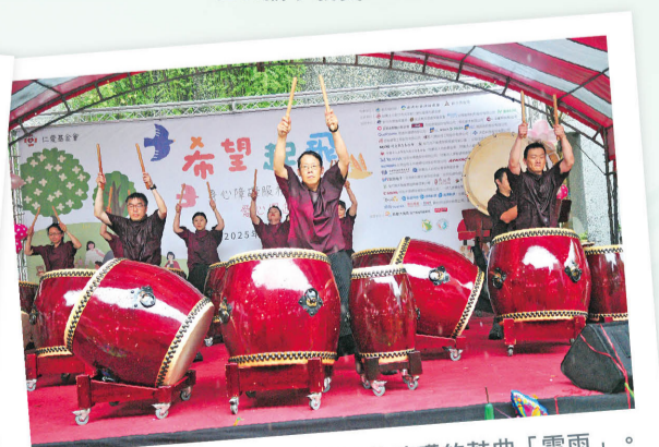
聯電竹科技隊冒著大雨表演氣勢磅礴的鼓曲「雷雨」。