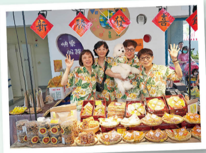
二十多年好朋友「新勝發餅店」從台北來相挺。