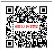
精彩花絮影片請掃描即可觀看。

第5關 我會安排有益健康的作息 教大家建立良好生活習慣，透過配對圖卡學會日曬、遠離3C、放鬆減壓等健康作息，打下良好基礎。