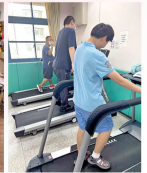
服務對象使用跑步機，提升強度與頻率均足的運動。