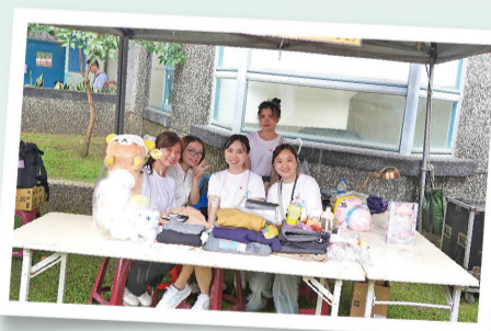
送子鳥診所十多年來支持設攤，捐贈全數所得。